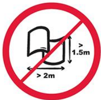
Banery lub flagi o wymiarach większych niż 2.0 m x 1.5 m.