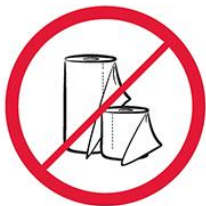
Duże ilości papieru