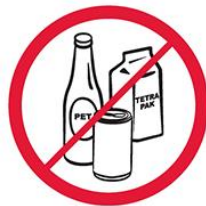
Butelki, puszki, kubki, dzbanki