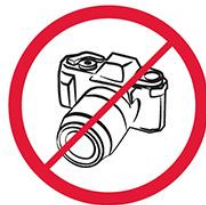
Profesjonalne aparaty fotograficzne, kamery wideo