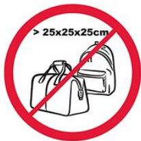
Pudła, torby, plecaki, walizki i inne wszelkie przedmioty większe niż 25 cm x 25 cm x 25 cm