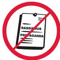
Materiały propagandowe o charakterze rasistowskim, ksenofobicznym, politycznym, religijnym