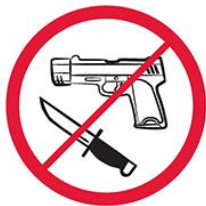
Broń, materiały wybuchowe, noże