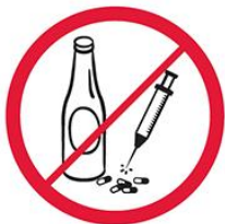
Napoje alkoholowe, narkotyki