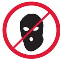
Części ubioru zakrywające twarz, kominiarki