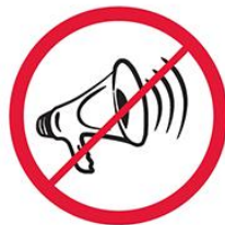
Megafony, syreny, inne urządzenia emitujące dźwięk