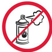
Gaz w aerozolu, substancje żrące, łatwopalne, barwniki