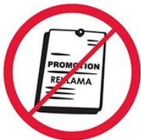
Przedmioty, materiały, ubrania komercyjne i promocyjne