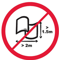
Banery lub flagi o wymiarach większych niż 2.0 m x 1.5 m.