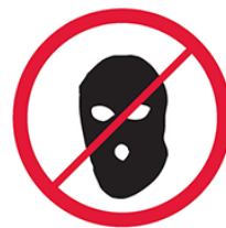
Części ubioru zakrywające twarz, kominiarki