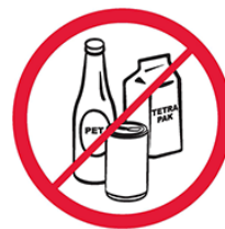
Butelki, puszki, kubki, dzbanki