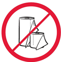
Duże ilości papieru