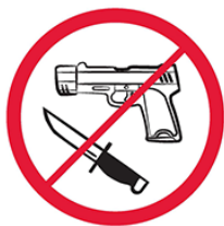
Broń, materiały wybuchowe, noże