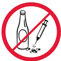
Napoje alkoholowe, narkotyki