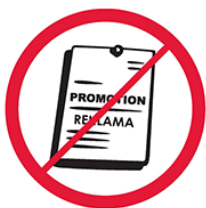
Przedmioty, materiały, ubrania komercyjne i promocyjne