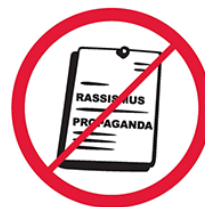
Materiały propagandowe o charakterze rasistowskim, ksenofobicznym, politycznym, religijnym