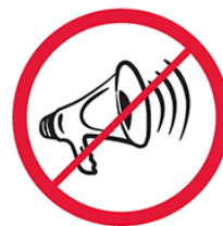
Megafony, syreny, inne urządzenia emitujące dźwięk