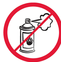
Gaz w aerozolu, substancje żrące, łatwopalne, barwniki