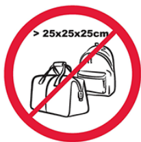
Pudła, torby, plecaki, walizki i inne wszelkie przedmioty większe niż 25 cm x 25 cm x 25 cm