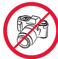
Profesjonalne aparaty fotograficzne, kamery wideo